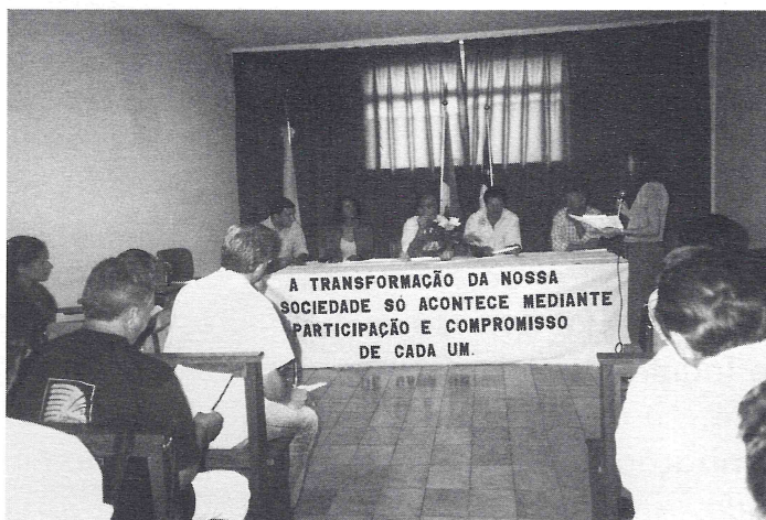
Representantes da população de Triunfo discutem orçamento do município.

A participação da sociedade em relação ao Orçamento Público municipal começou com o incentivo da