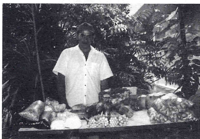
Espaço Agroecológico no Museu do Homem do Nordeste