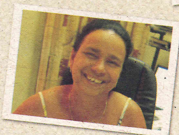
Entrevista: Agroecologia em Cuba