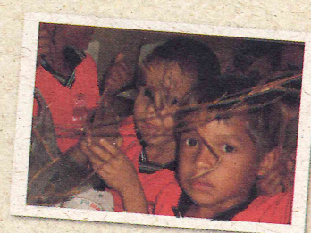
Educação ambiental em escolas