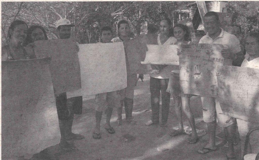
Agricultores/as apresentam os desenhos que fizeram da propriedade