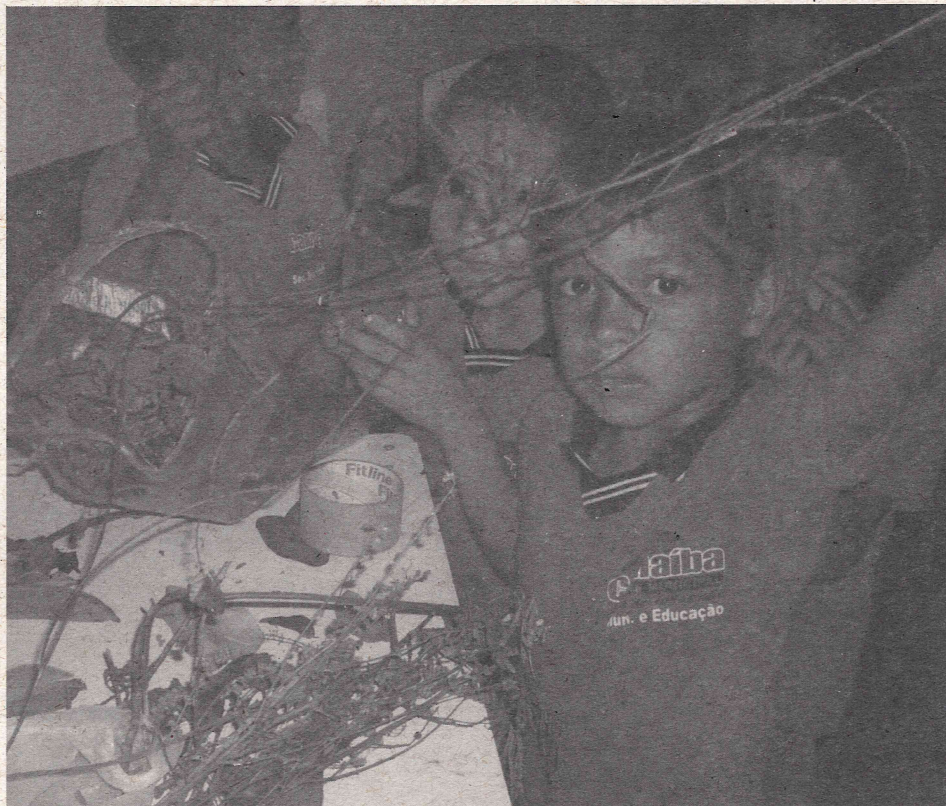
Criança durante oficina sobre plantas da Caatinga – Carnaíba/PE