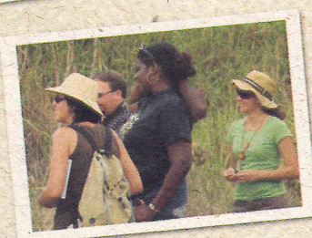
Cooperação Internacional visita o Sabiá