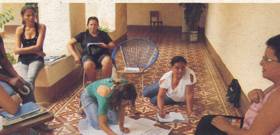
A avaliação do Sertão aconteceu em Triunfo, durante do Fórum das Comunidades