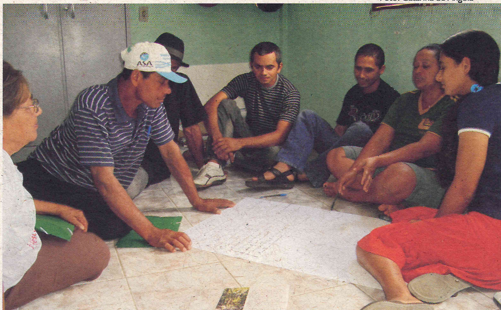
Agricultores e agricultoras do Agreste durante a avaliação.

Os/as agricultores/as fizeram avaliação em trabalhos de grupos, a partir dos temas produção e transição agroecológica, segurança alimentar, gênero, juventude, políticas públicas, comunicação e gestão. No planejamento, cada município apresentou suas demandas. Os resultados apresentados pelos agricultores/as irão fazer parte da avaliação anual do Centro Sabiá e também do planejamento da instituição para o ano de 2010.