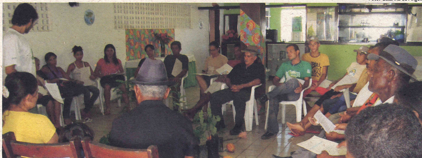
Na Zona da Mata agricultores e agricultoras se reuniram em Sirinhaém