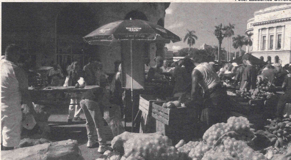
Feira de produtos agrícolas em Havana Velha – Cuba