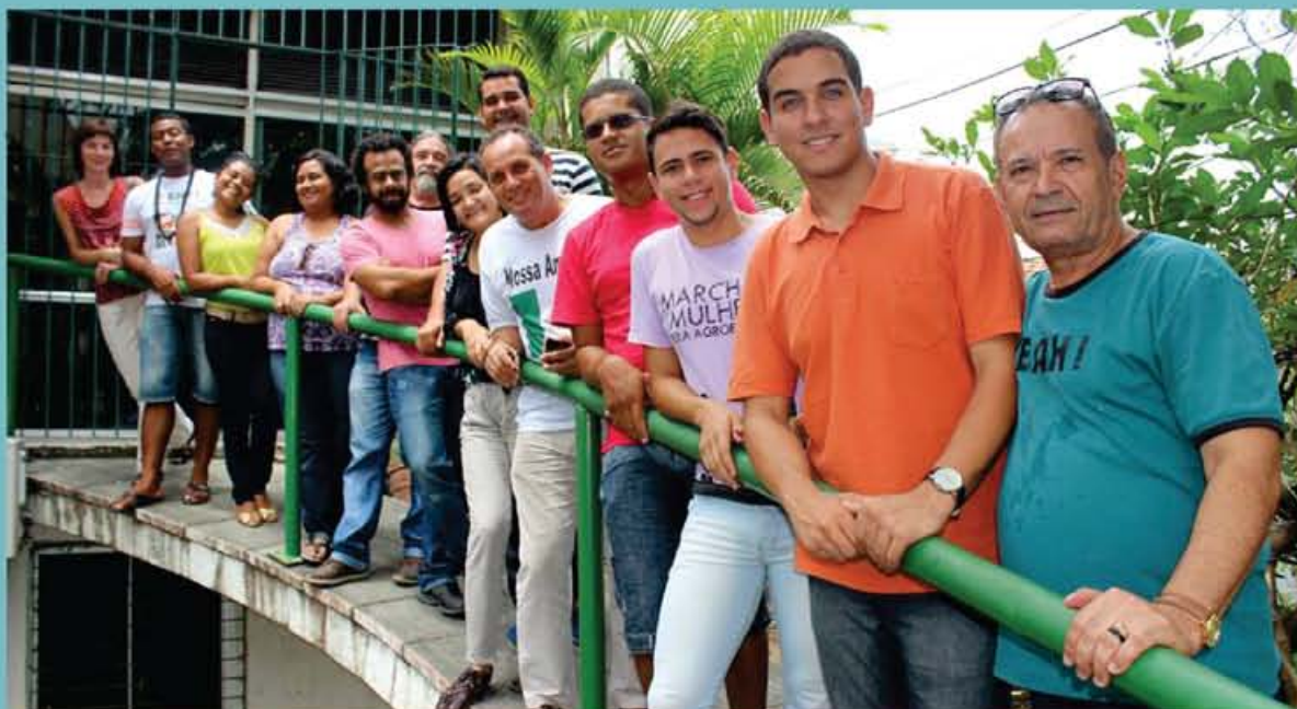
Participantes das oficinas de Histórias Digitais que aconteceu no Recife

Comissão Territorial de Jovens Multiplicadores de Agroecologia foi retratada por jovens participantes da oficina no Recife