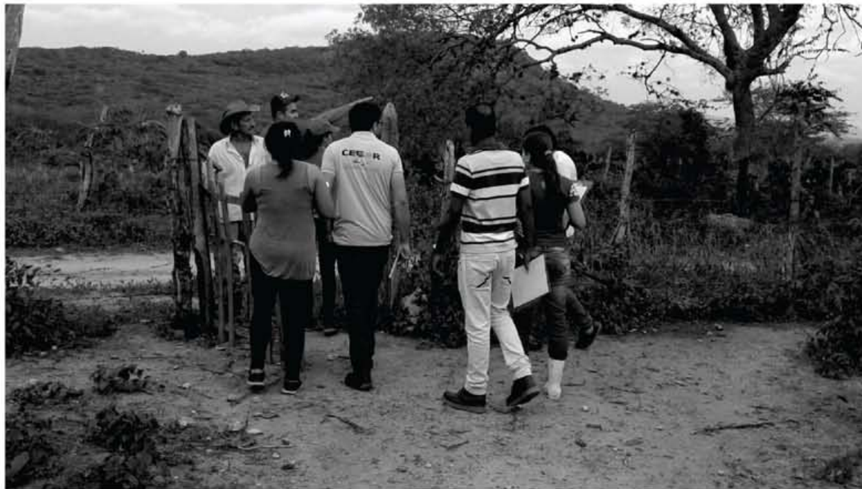
Capacitação em CAR envolveu técnicas e técnicos da chamada de ATER