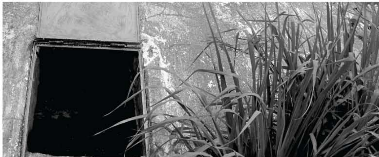
Cisternas devem ficar bem fechadas para evitar focos