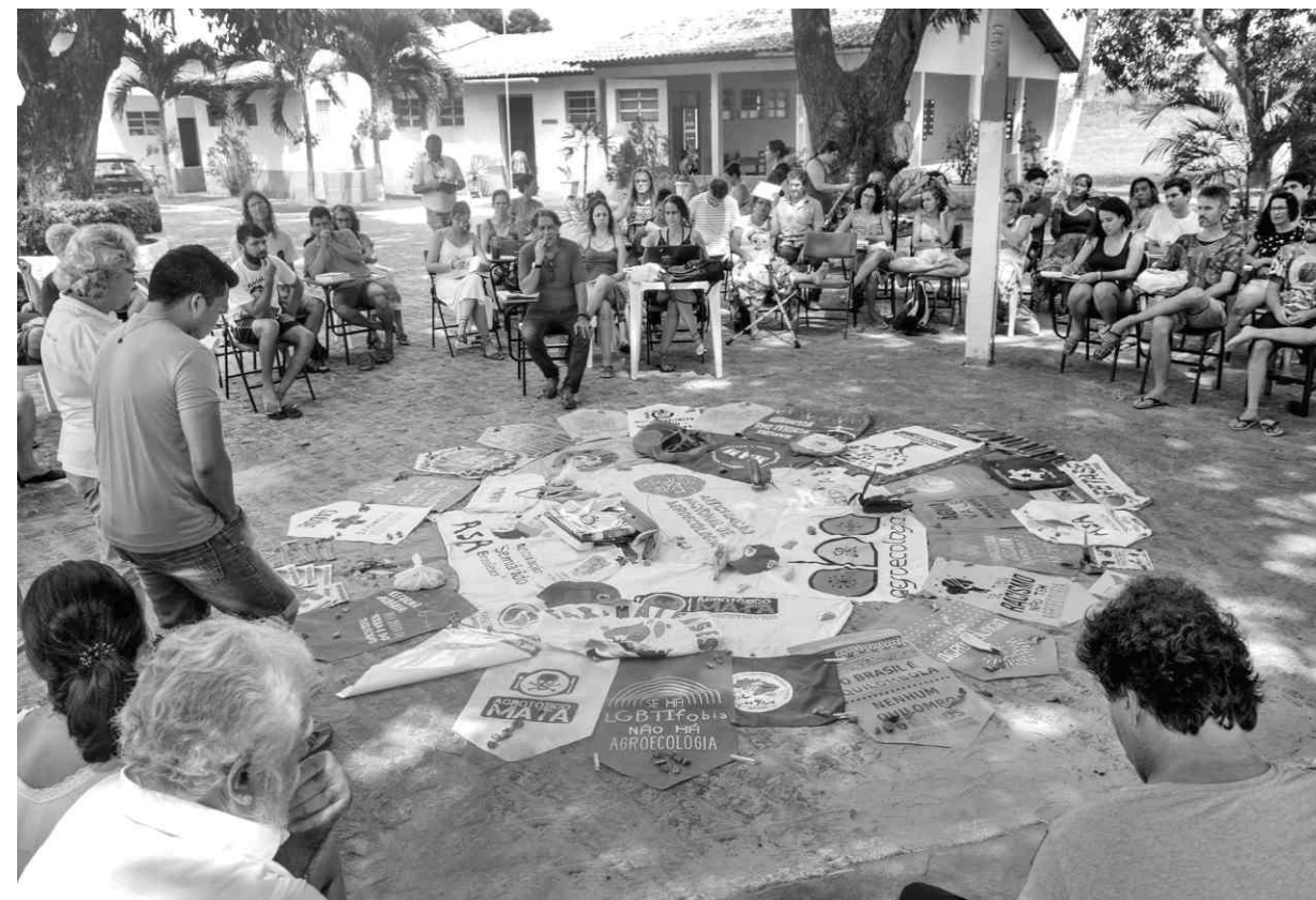
Plenária Nacional da Articulação Nacional de Agroecologia (ANA), na cidade de Aracaju - SE.