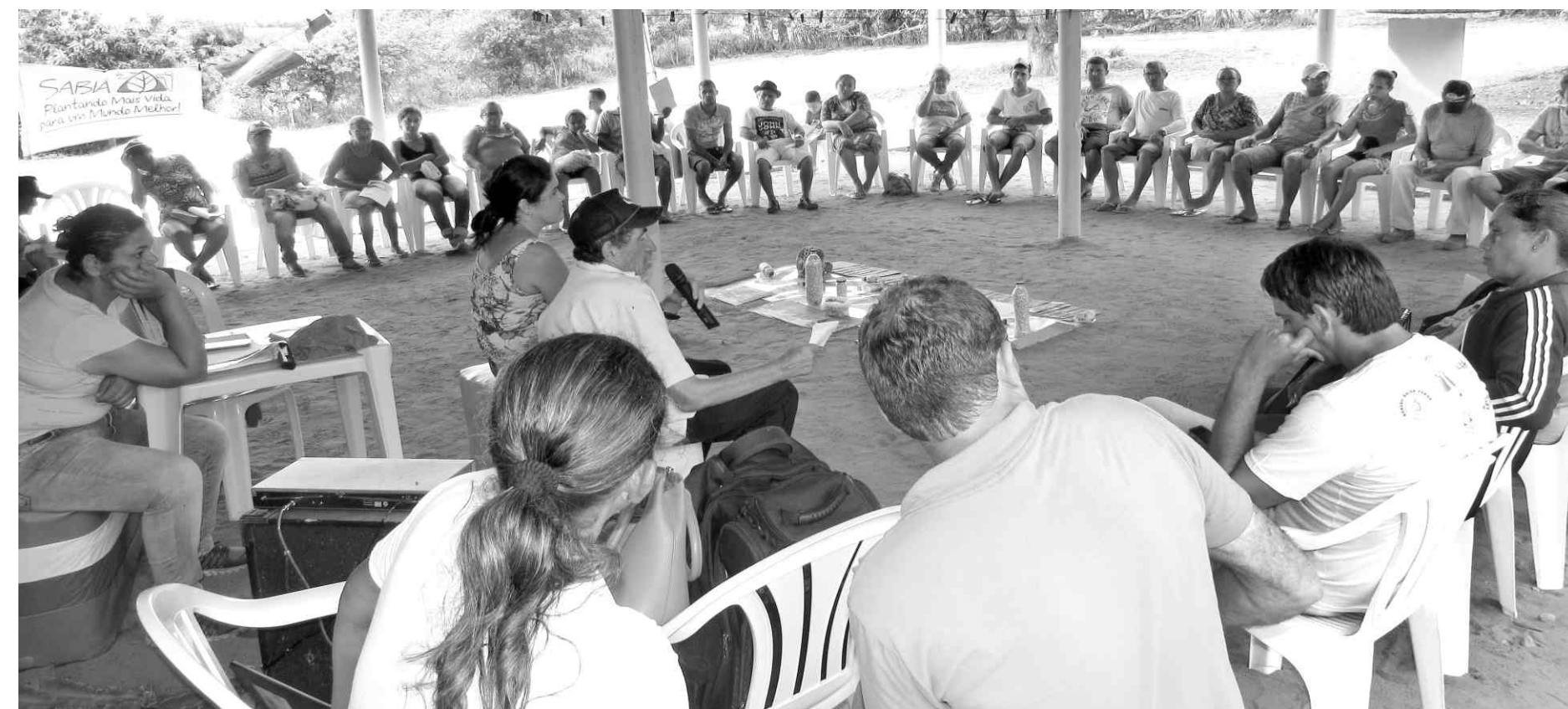
Encontro Territorial, realizado no município de Caruaru, Agreste de Pernambuco