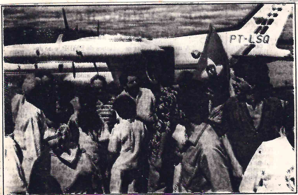
Lula apóia o fórum contra a seca e diz que "povo com fome não vota com a cabeça"