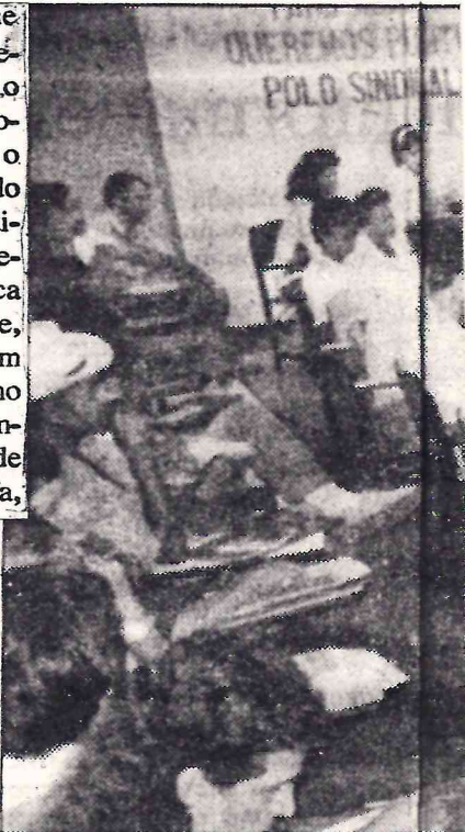
Todas as implicações contidas na prob-

Esses e outros estudos, bastante difundidos por centros a-