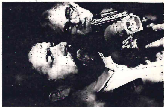
Luis Inácio da Silva chega hoje

Lula deverá chegar em Serra Talhada um pouco antes das 9h30, horário previsto para o lançamento do Fórum. Ele retorna ao Recife às 12h, concedendo entrevista coletiva à Imprensa, às 13h, no Hotel do Sol, em Boa Viagem, seguindo depois para São Paulo.