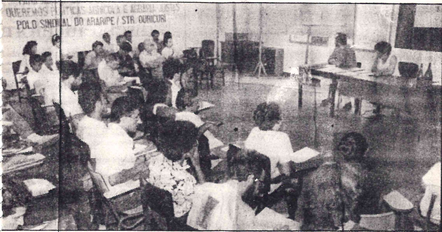
ões contidas na problemática da seca estão sendo debatidas por lideranças e técnicos

líticos e econômicos — ligados à seca estão sendo debatidos em uma gibe. As primeiras conclusões indicam que há soluções para a seca