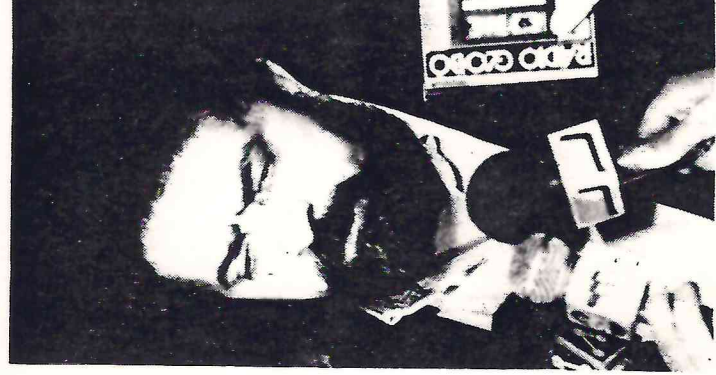
Lula é esperado em Serra Talhada

A estreiteza política evidenciada neste comportamento não deixa dúvidas para se concluir que o PT local não desejava dividir as eventuais conquistas políticas com um político capaz de fazer sombra ao seu partido. Mais sensata, a direção local da agremiação e o próprio Lula condenaram a atitude, mas já era tarde: Arra-