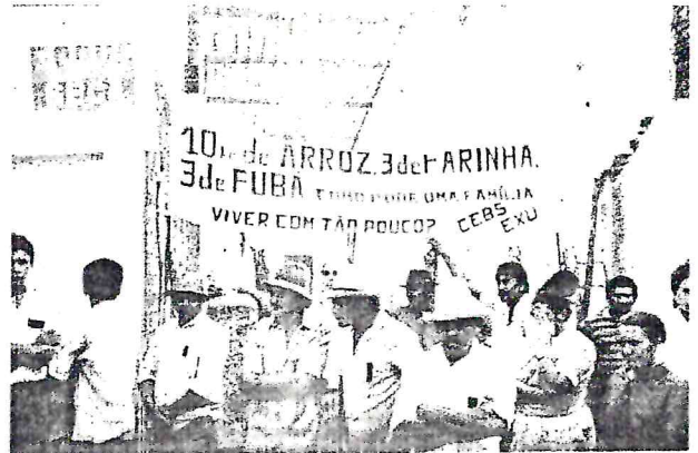
Ato Público de Lançamento do Forum Seca Serra Talhada - 05/05/90