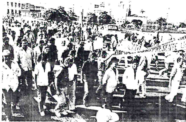
Passeata de Agricultores rumo ao Palácio do Campo das Princesas - 21/11/91