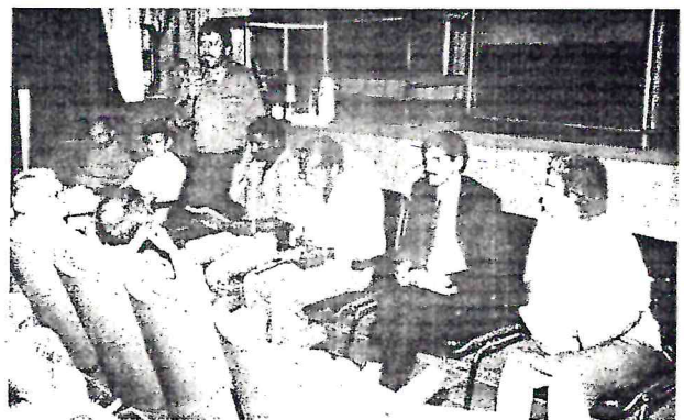
Debate sobre a seca - Sindicato dos Bancários Recife - 19/11/92