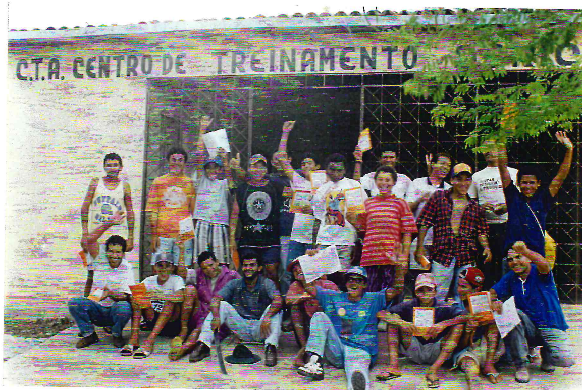
Participantes do I Curso sobre agricultura sustentável - Agroflorestação, em Princesa Isabel (PB)