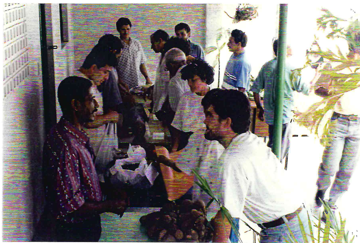
“Jogo da Feira”, dinâmica realizada durante o Seminário Implantação de sistemas agroflorestais - da experiência à difusão; da produção à comercialização

Este processo já foi iniciado no ano de 1996 e pretende ser concluído no ano de 1997. Em 1996 foram realizados dois seminários. O primeiro, em outubro, onde foram definidos os objetivos e interesse específicos da sistematização do Centro Sabiá, bem como para afinar a metodologia a ser utilizada. O segundo, dentro do planejamento anual (dezembro), que montou um matriz operacional para a sistematização. As atividades previstas são: estudo e análise de documentos e informações; elaboração de relatórios; e seminários de devolução e regionais.