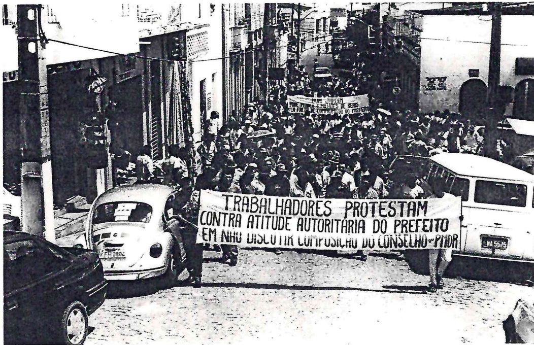
Passeata em favor da aprovação do PMDR de Bom Jardim