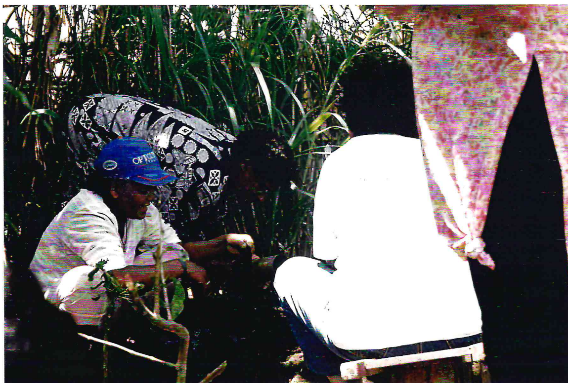
Agricultoras de Umari, Bom Jardim, preparam um viveiro agroflorestal.

Em final de outubro foi realizado um primeiro curso de dois dias para difusores, com a participação de dez agricultores/as experimentadores/as de Bom Jardim e um de Abreu e Lima. Além do conteúdo, da metodologia, dos instrumentos, dos objetivos e metas da difusão de agricultor para agricultor, foi discutida amplamente a questão da compensação do trabalho extra. Os participantes opinaram contra uma remuneração em dinheiro e em favor de um sistema de compensação através de ferramentas, sementes, mudas e animais, para investir no desenvolvimento das suas propriedades. Para monitorar o registro do trabalho de difusão e material distribuído, foi eleita uma comissão de gestão do programa composta por um agricultor difusor, uma diretora do STR e um técnico do Centro Sabiá.