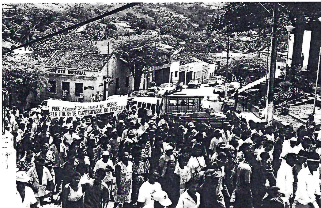
Mobilização pública para aprovar o PMDR de Bom Jardim

Mesmo assim, o STR buscou insistentemente o diálogo . Inúmeras tentativas foram feitas. O STR procurou ajuda de autoridades de fora do município para viabilizar as negociações com os governantes de Bom Jardim, entretanto as portas permaneceram fechadas. Simultaneamente a isto o Centro Sabiá buscou apoio junto à técnicos do Ministério da Agricultura e junto a parlamentares pernambucanos, participando de inúmeras reuniões para esclarecer o problema e identificar formas de solucioná-lo. Nada disto surtiu o efeito esperado. Esgotaram-se as possibilidades diálogo. Não havendo outra alternativa o sindicato organizou um movimento de esclarecimento e pressão como último recurso para abrir a negociação junto a prefeitura e vereadores do município