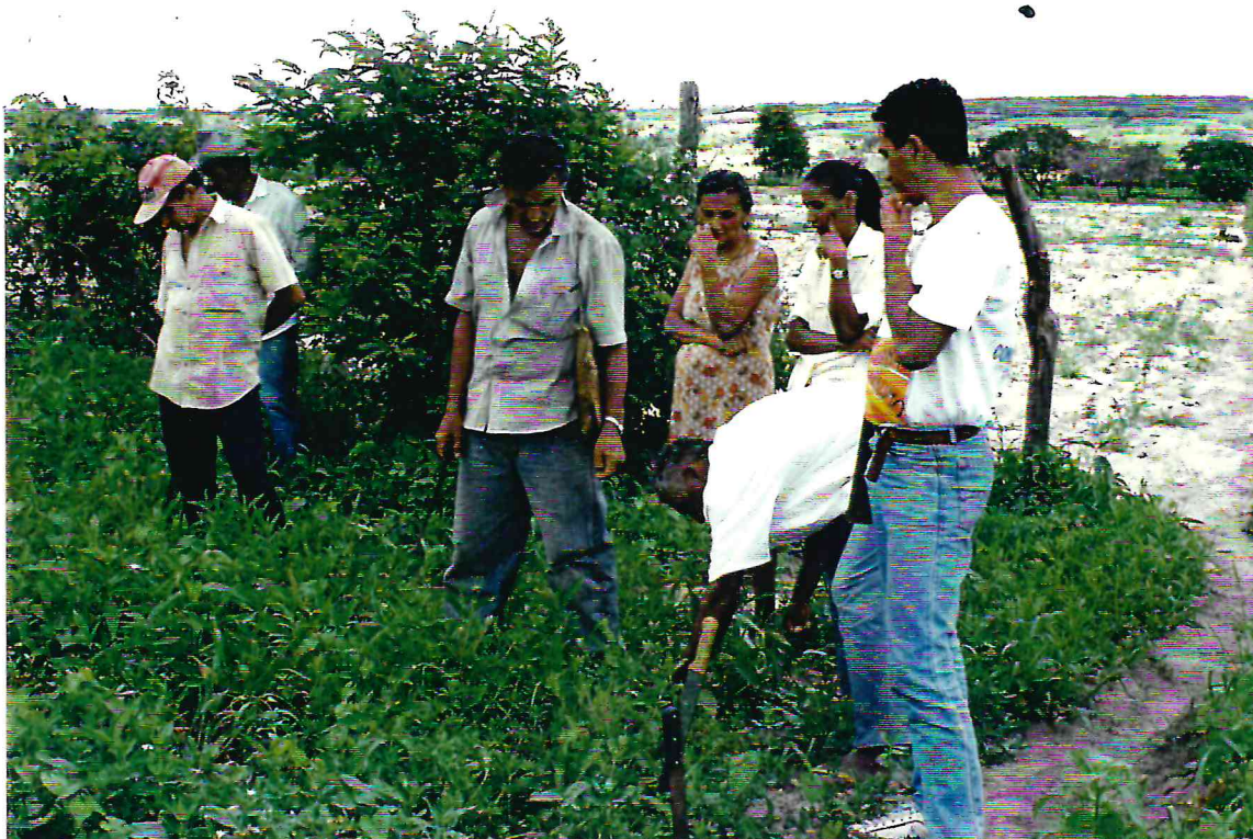
Treinamento sobre capina seletiva - Comunidade de Cipaúba, São José de Belmonte (PE)

Em avaliação realizada conjuntamente entre o Centro Sabiá e o Sindicato de Trabalhadores Rurais de São José de Belmonte, chegou-se a conclusão de que no geral o trabalho desenvolvido 1996 não apresentou mudanças significativas.