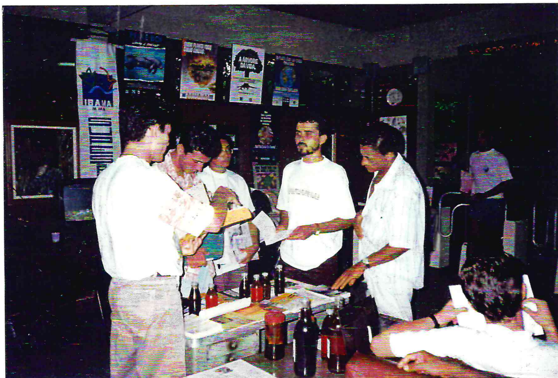
Stand do Centro Sabiá durante o IV Encontro Regional da Agricultura Alternativa, em Recife (PE).

No primeiro semestre, participamos em 03 eventos com exposição de publicações, fotografias, vídeos e produtos. No Lançamento da cartilha sobre Agricultura Familiar de Bom Jardim (março) ; no I Salão Nordestino da Agricultura Familiar (participação no stand da Rede PTA) e IV Encontro Regional de Agricultura Alternativa - UFRPE . Tivemos boa receptividade entre os/as participantes destes eventos, com procura de informações, estâgios e aquisição de publicações.