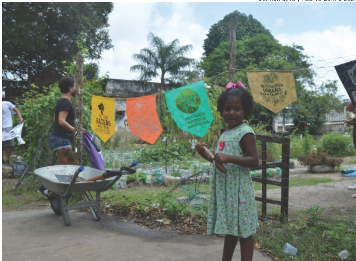
Mapeamentos visibilizam experiências de agricultura urbana Brasil afora

Um dos assuntos em pauta no CNAU 1 é a necessidade de realização de um mapeamento nacional que articule informações já produzidas em mapeamentos locais. Em 2007, foi realizado um estudo sobre a agricultura urbana no Brasil que deu origem à publicação “Panorama da Agricultura Urbana e Periurbana”. O estudo